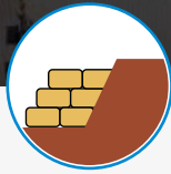
Estructuras de gravedad

Está diseñado para ser llenado en el sitio por medios mecánicos o hidráulicos con suelo o cualquier clase de material térreo disponible, obteniendo unidades de gran masa y volumen que se acomodan sobre terreno de manera versátil por su tamaño y forma. HYDROBLOCK es utilizado en la construcción de estructuras de control hidráulico, control de erosión en orillas y rehabilitación de orillas erosionadas, revestimiento de diques, terraplenes y taludes de cauces, realce de orillas, realce de corona en estructuras de control hidráulico y protección de tuberías subacuáticas.